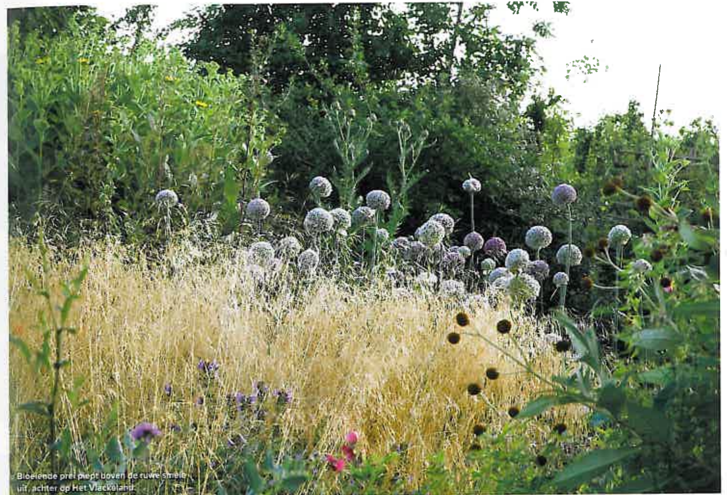
Bloeiende prei piept boven de ruwe smelt uit, achter op Het Vlackeland.

Het Spaanse juffertje-in-'t-groen is volgens Madelien "temperamentvoller" dan het traditionele juffertje. Hier met de rode rokjes van de klaproos.