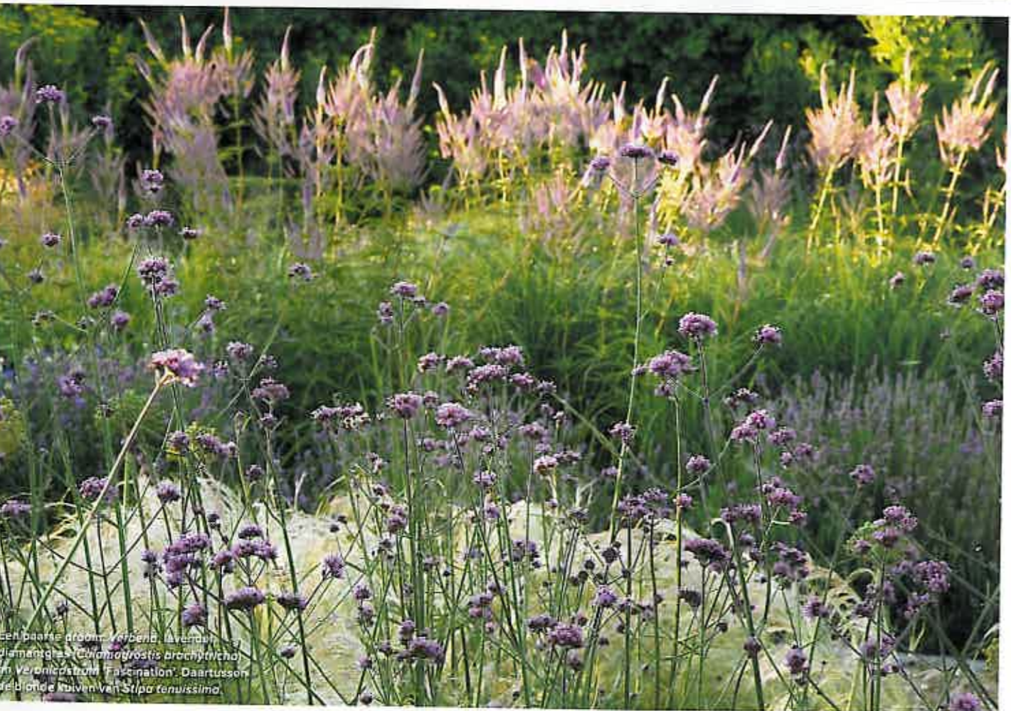
Een baarse droom Verbena leverduin, diamantglas Cyanagrostis brachytricha en Veronicastrum 'Fascination' . Daartussen deblonde kruiden van Stipa tenuissima .

"Vijftwintig jaar geleden startte ik mijn hoveniersbedrijf. Toen al had ik de wens om een eigen voorbeeldtuin in te richten. Daarin wilde ik mensen laten zien wat je met planten kunt doen én hoe ze er in volwassen vorm uitzien. Ik ben lange tijd op zoek geweest naar een geschikte locatie. Acht jaar geleden diende zich een onverwachte kans aan. Onze buurvrouw zette haar boerderijtje met land te koop. Daarvan kochten wij een L-vormig stuk land van bijna een hectare met daarop een oude wagenshuur. Hier konden we een tuin aanleggen én een kantoor bouwen voor mijn bedrijf. Naast de deur, wát een geluk!"