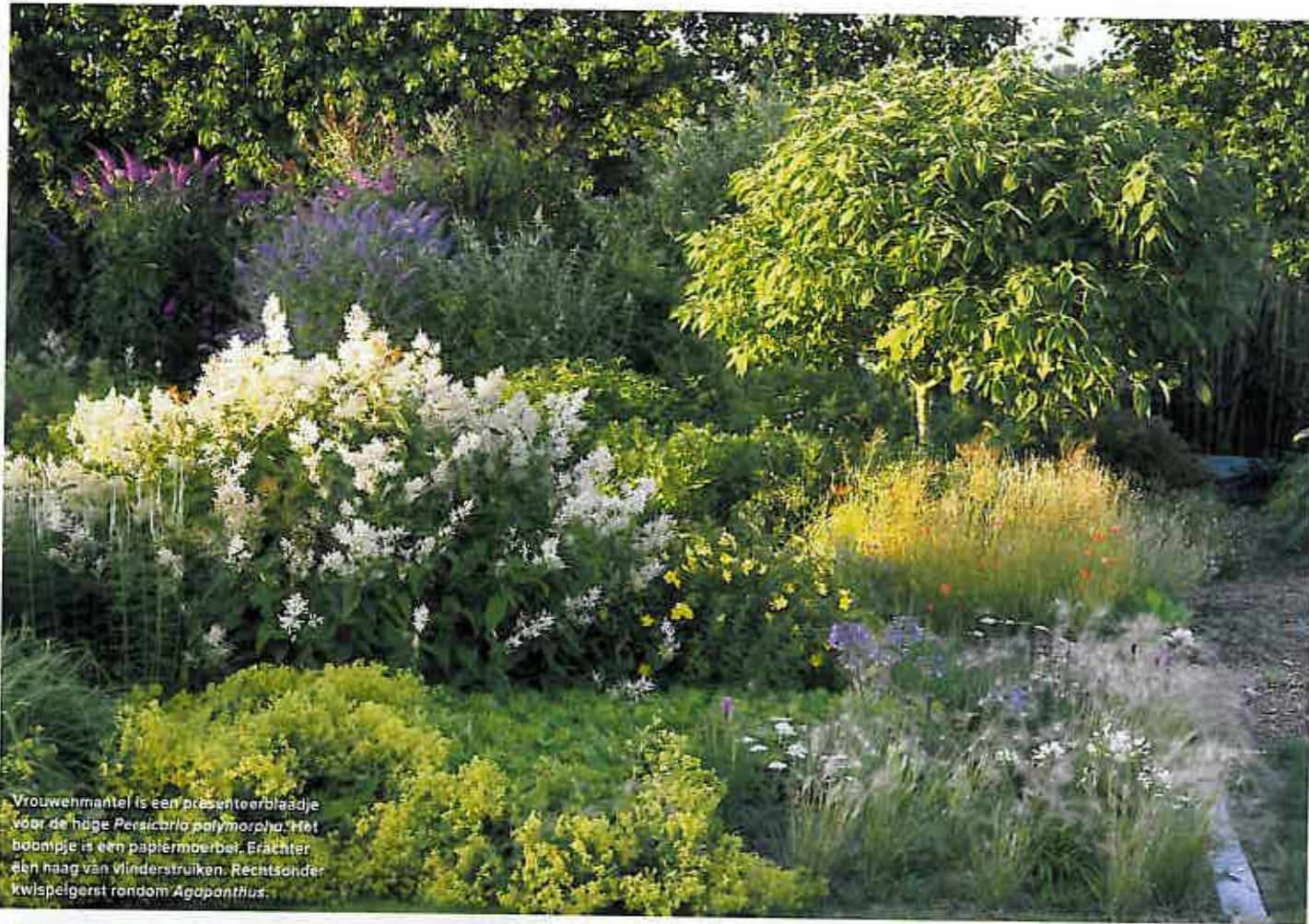
Vrouwemantel is een presenteerblaadje voor de hoge Panicum polymorphum . Het boompje is een papiermoerbeer. Erachter één haag van vinderstruiken. Rechts onder kwispelgerst rondom Agapanthus .