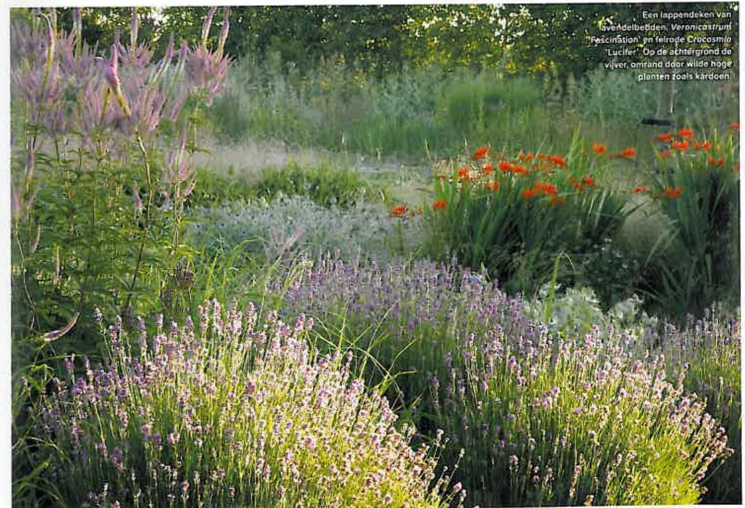
Een lappendeken van lavendelbedden, Veronicastrum 'Fascination' en felrode Crocus 'Lucifer' . Op de achtergrond de vijver, omrand door wilde hoge planten zoals kardoen.